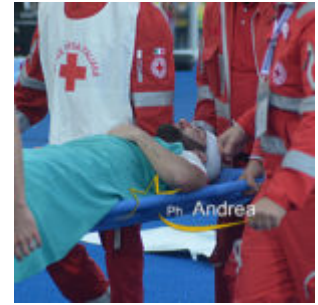
higuain viene portato via in barella