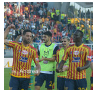
i calciatori del lecce esultano a fine gara