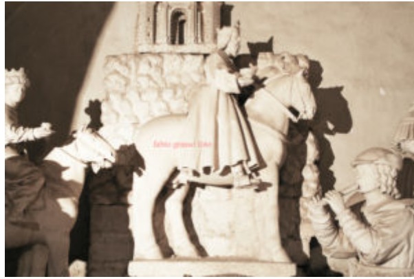
Fig. 2. Lecce, Cattedrale, altare del presepe, autore: Gabriele Riccardo, part.

La storiografia, sottolineando l'importanza dell'argomento, anche in tempi più recenti si è dedicata a questo presepe cercando di risolverne un aspetto in particolare: quello cronologico. Nel 1991 Mario Cazzato ( Il presepe della cattedrale di Lecce: per la biografia artistica di Gabriele Riccardi , in V rassegna internazionale del presepe nell'arte e nella tradizione , pp. 79 – 83), oltre a ricordare quanto contenuto nella visita pastorale del 1555 e nella Lecce Sacra dell'Infantino , riporta (p. 80) il passo di Scipione Ammirato: «la cappella de baroni di Campie dal vecchio Luigi (Maria Paladini) instituita, ma da Ferrante suo figliolo di statue adornata [...]». Lo studioso integra quindi il testo originale dell'Ammirato con una parte tra parentesi tonde in cui si legge «Luigi (Maria Paladini)» lasciando intendere che chi istituì la cappella fu Luigi Maria Paladini. Nello stesso saggio il medesimo autore precisa (p. 82): «Per quanto riguarda l'opera in se stessa, è difficile credere che sia stata eseguita prima del 1546, l'anno cioè che Luigi Maria, cessata la tutela materna, divenne maggiorenne; pertanto, poiché nella visita del 1555 non si parla del presepe come di un'opera recente, è possibile congetturare che esso rimonti proprio alla metà del secolo (1550 ca) [...]».