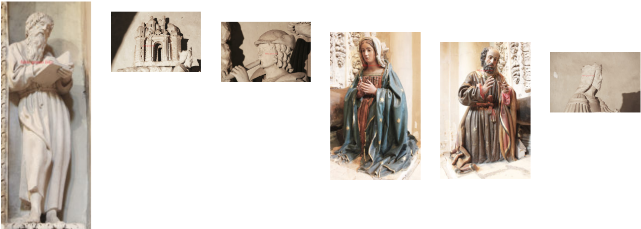
Figg. 5. Lecce, Cattedrale, altare del presepe, autore: Gabriele Riccardo, partt.

due tempi che prevedeva la distribuzione delle statue su due piani: uno inferiore più vicino al credente con la Sacra Famiglia, il bue e l'asino e l'altro, nella parte sommitale, con la scena bucolica e il viaggio dei Magi, come qui già segnalato. Questo tipo di soluzione è plausibilmente alla base di una scelta tipologica particolare, quella cioè dell'altare a baldacchino che, è necessario precisare, non rappresenta una novità introdotta a seguito di questo intervento ma, allo stesso tempo, non risulta, sulla base delle attuali conoscenze, neppure un caso tipologico assai frequentemente usato a Lecce prima di tutto. Questo rapporto, quindi, fra forma e volontà narrativa appare interessante. Chi fu l'autore di questa soluzione che è prima di tutto da architetto (a giudicare dalla capacità di articolare "narrazioni" di più elementi nello spazio) e poi da scultore? Non certo Giuseppe Cino (notevoli sono, infatti, le differenze stilistiche rilevabili rispetto alle opere di tale scultore in particolare) benché quest'ultimo fosse uno dei più importanti artisti sul finire del Seicento e fino alla sua scomparsa.