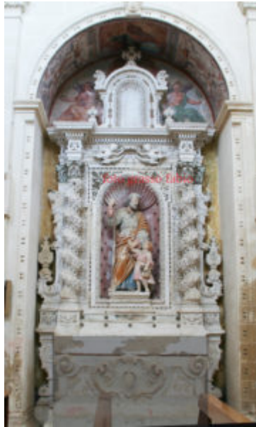
Fig.11. Copertino (Lecce), chiesa della Grottella, altare di San Giuseppe, Giuseppe Longo da Lecce (autografo), 1691.