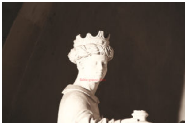
Fig. 3. Lecce, Cattedrale, altare del presepe, autore: Gabriele Riccardi, part.

Il brano di Scipione Ammirato è riproposto con la medesima integrazione (che è quindi confermata) «Luigi (Maria Paladini)» anche in un'altra circostanza (Monaco A. M., Continuità e distanza nell'iconografia del presepe pugliese: La cavalcata dei Magi di Gabriele Riccardi e l'Adorazione del Bambino nel duomo di Lecce , in La scultura meridionale in età moderna nei suoi rapporti con la circolazione mediterranea , atti del convegno internazionale di studi a cura di Letizia Gaeta -Lecce, 9-10-11 giugno 2004-, Università degli studi di Lecce – dipartimento dei Beni delle Arti e della storia, Galatina, Congedo Editore, 2007, pp. 379-397.e in part. p. 394). Quest'ultimo studioso, a proposito della datazione, pone inoltre l'attenzione ( Ibidem , p. 382) su un dettaglio del presepe ovvero la veduta di città che è scolpita nella parte sommitale (Fig. 6) e sul fatto che possa esistere una «corrispondenza» tra la porta raffigurata in tale immagine di città e quella di una delle porte urbiche leccesi (la cosiddetta Porta Napoli) datata 1548. Scrive quindi Angelo Maria Monaco: «Tale corrispondenza, individuata da Clara Gelao, ci fornisce indirettamente un utile terminus post quem [i corsivi sono dell'autore, n.d.r.] relativo alla datazione dell'intero complesso, da ritenere, dunque successivo all'anno 1548 (data incisa sull'architrave di Porta Napoli [...])». Il testo di Clara Gelao è in Gabriele Riccardi e il presepe della