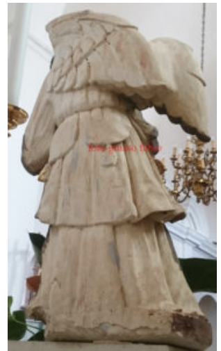
Figg. 12 – 15. Seclì (Lecce), chiesa conventuale di Sant'Antonio da Padova, altare maggiore, angeli laterali, Giuseppe Longo da Lecce (attr.).