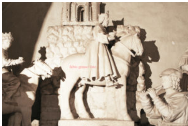
Fig. 2. Lecce, Cattedrale, altare del presepe, autore: Gabriele Riccardo, part.

La storiografia, sottolineando l'importanza dell'argomento, anche in tempi più recenti si è dedicata a questo presepe cercando di risolverne un aspetto in particolare: quello cronologico. Nel 1991 Mario Cazzato ( Il presepe della cattedrale di Lecce: per la biografia artistica di Gabriele Riccardi , in V rassegna internazionale del presepe nell'arte e nella tradizione , pp. 79 – 83), oltre a ricordare quanto contenuto nella visita pastorale del 1555 e nella Lecce Sacra dell'Infantino , riporta (p. 80) il passo di Scipione Ammirato: «la cappella de baroni di Campie dal vecchio Luigi (Maria Paladini) instituita, ma da Ferrante suo figliolo di statue adornata [...]». Lo studioso integra quindi il testo originale dell'Ammirato con una parte tra parentesi tonde in cui si legge «Luigi (Maria Paladini)» lasciando intendere che chi istituì la cappella fu Luigi Maria Paladini. Nello stesso saggio il medesimo autore precisa (p. 82): «Per quanto riguarda l'opera in se stessa, è difficile credere che sia stata eseguita prima del 1546, l'anno cioè che Luigi Maria, cessata la tutela materna, divenne maggiorenne; pertanto, poiché nella visita del 1555 non si parla del presepe come di un'opera recente, è possibile congetturare che esso rimonti proprio alla metà del secolo (1550 ca) [...]».