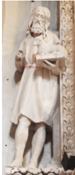
Fig. 4. Lecce, Cattedrale, altare del presepe, autore: Gabriele Riccardo, part.

cattedrale di Lecce in Il presepe artistico pugliese: arte e folklore , Bari: Mario Adda, 1992, pp. 77 – 81, in part. p. 77.