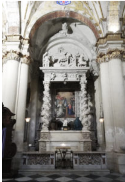
Fig. 1. Lecce, Cattedrale, altare del presepe, autore: Gabriele Riccardo

La paternità del presepe che è nella cattedrale di Lecce è riconosciuta a Gabriele Riccardo da Giulio Cesare Infantino che, nella sua Lecce Sacra , edita nel 1634, redige un sorta di primo elenco delle opere del celebre artista leccese. Il parroco di Santa Maria della Luce ebbe modo di vederlo nella sua collocazione e conformazione plausibilmente originaria nella cappella della famiglia Paladini cui apparteneva. Prima dell'Infantino, però, se ne era occupato anche Scipione Ammirato (Mesagne, 1531 – Firenze, 1601) in una sua opera intitolata Della famiglia de' Paladini di Lecce , edita nel 1595 a Firenze (Appendice documentaria n°. 1). E ci limitiamo a costoro giusto per ricordare solo gli autori principali che hanno dedicato la loro penna a tale significativa opera scultorea.