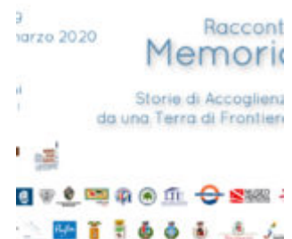
Sbarco albanesi nel salento